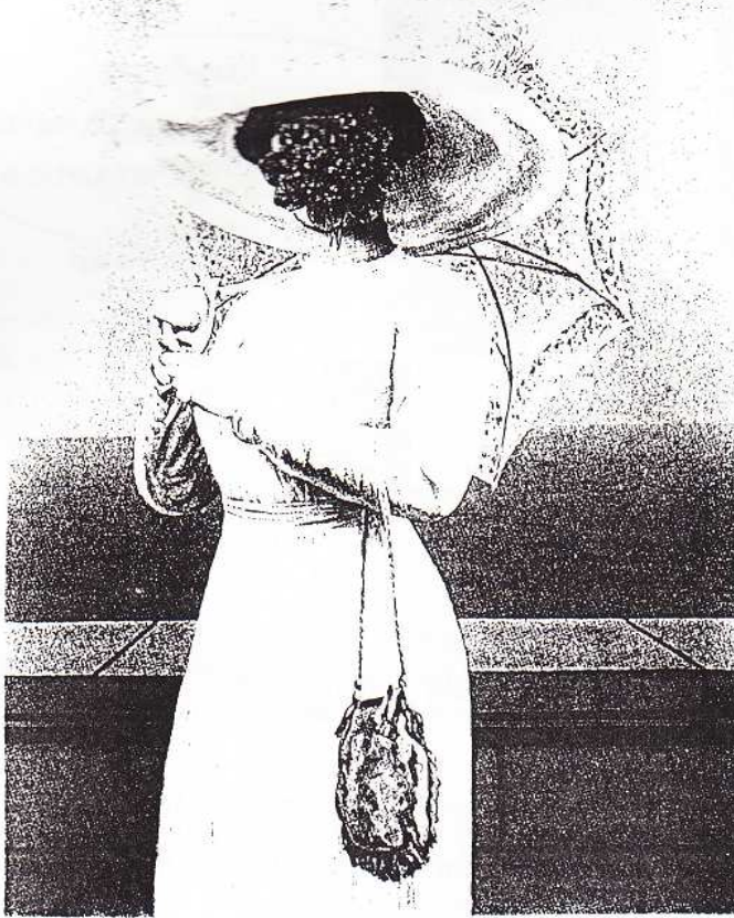
La grande guerre

Le siège de la société "Belgacom" a aujourd'hui connu une grosse frayeur.